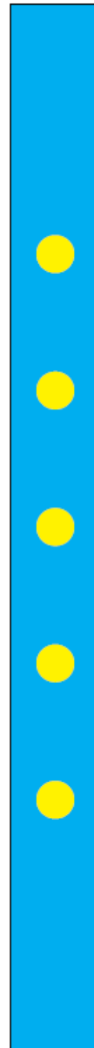
Fig. 2. Hengsel