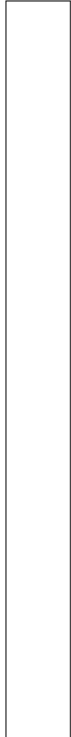
Fig. 2. Hengsel