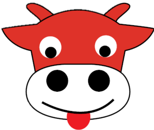
Fig. 2. Kop