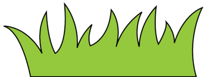
Fig. 3. Gras