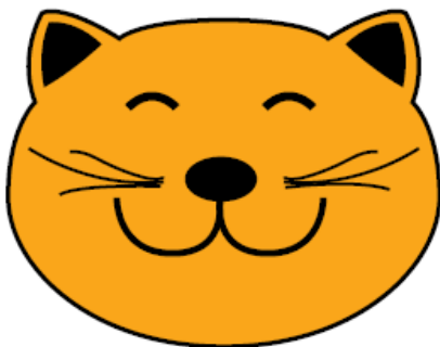
Fig. 2. Kop